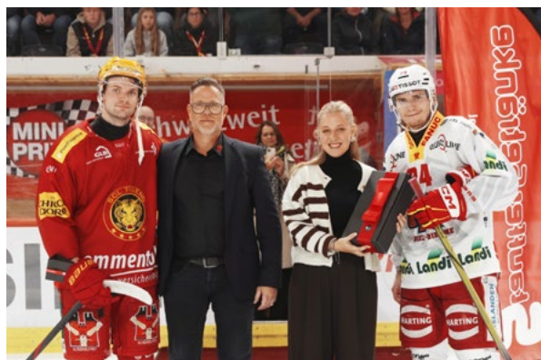
Lors de la remise du prix du meilleur joueur